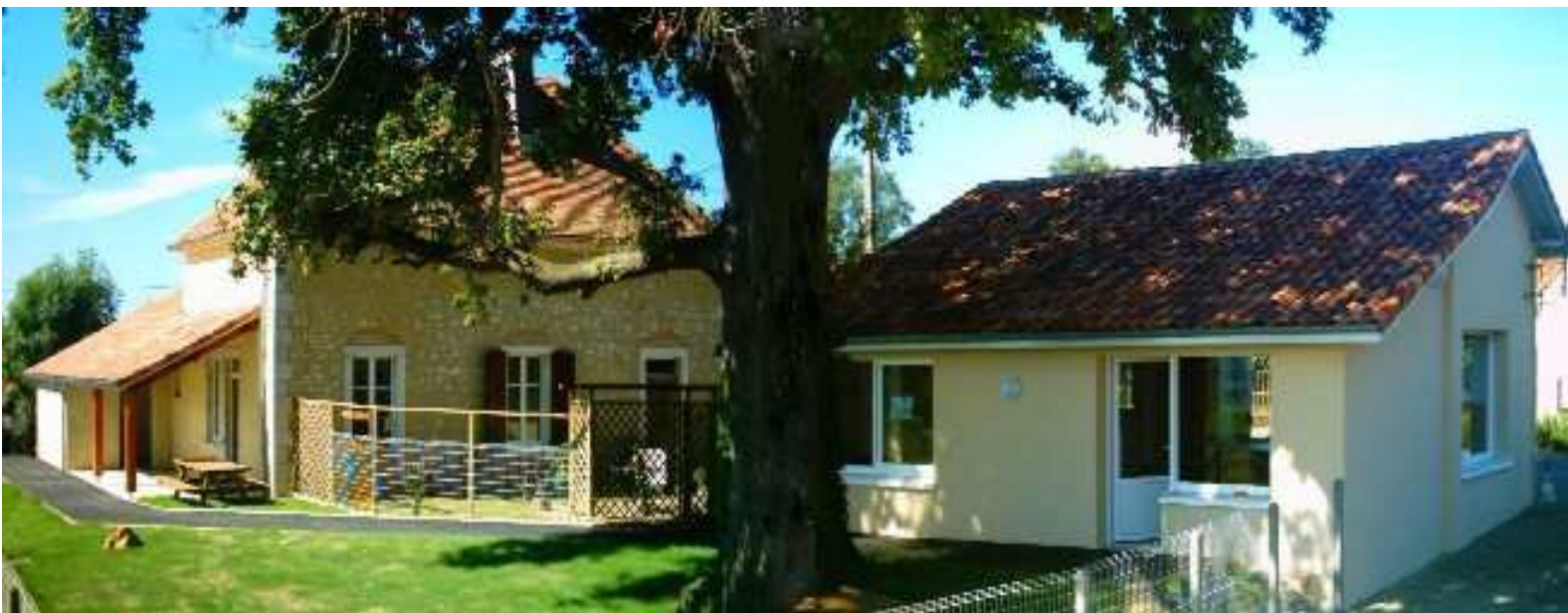
ATELIER PEDAGOGIQUE DE POTERIE DE BOUILLON