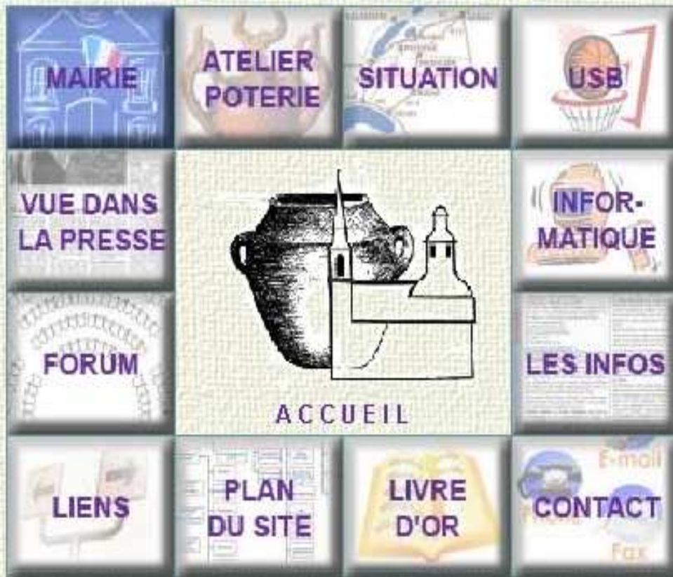
page d'accueil du site de Bouillon